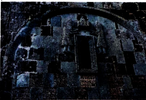
Детайл от манастира Дадиванк с арменска писменост и резбовани фигури.

На 3 февруари т.г. Министерството на културата на Азербайджан предизвика недоволство, когато обявя създаването на Комитет, който ще предприеме стъпки за „премахване на фиктивните следи, оставени от арменците върху албанските религиозни храмове“ в превзетите райони.